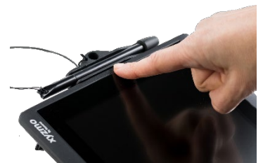
Stiftfach flexibel anzuschrauben